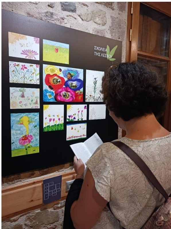
Επισκέπτρια της έκθεσης μπροστά από επιλεγμένα έργα σχολείων της Λέσβου