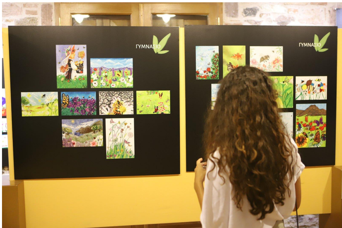
Επισκέπτρια της έκθεσης μπροστά από έργα μαθητών Γυμνασίου