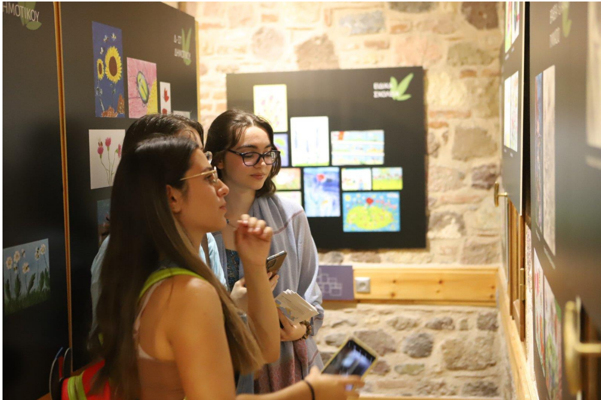
Μαθήτριες που συμμετείχαν στον Πανελλήνιο Μαθητικό Διαγωνισμό Ζωγραφικής