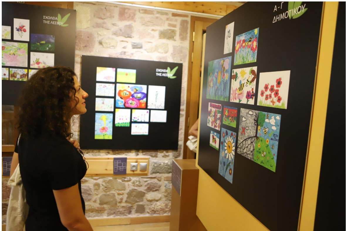
Επισκέπτες της έκθεσης