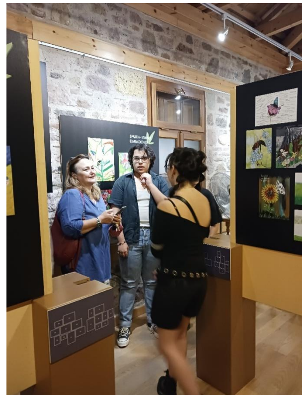
Επισκέπτες της έκθεσης